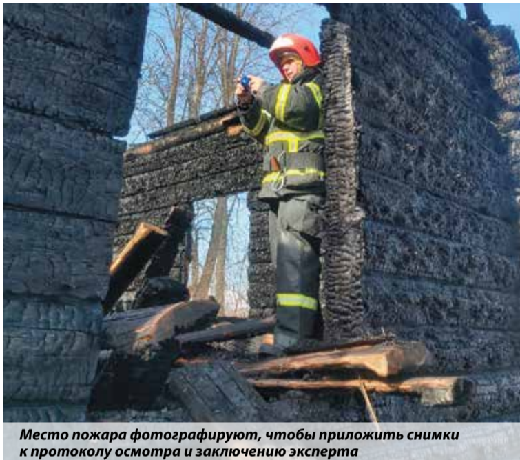
Место пожара фотографируют, чтобы приложить снимки к протоколу осмотра и заключению эксперта