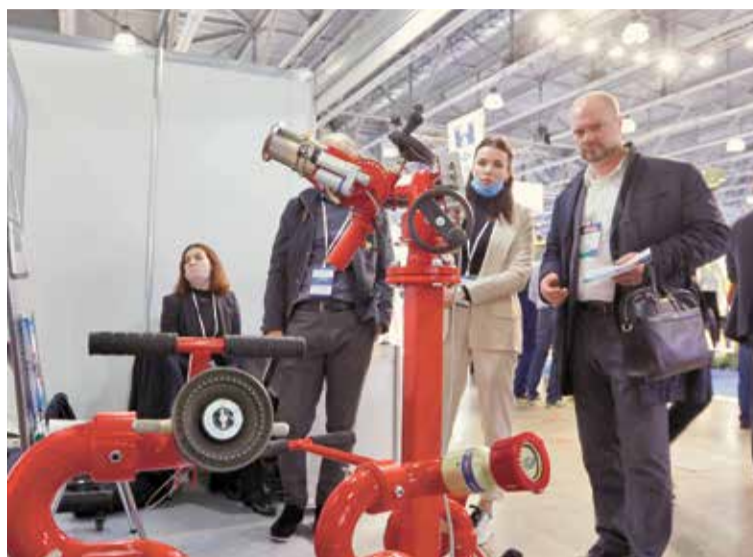
Современное противопожарное оборудование неизменно вызывает высокий интерес у посетителей научно-технических салонов

Это особенно важно с позиций достижения информационного превосходства и формирования надежной системы обеспечения информационной безопасности в условиях глобального цифрового пространства.