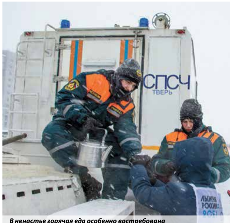
В ненастье горячая еда особенно востребована

Виктория Ротарь, пресс-служба ГУ МЧС России по Тверской области