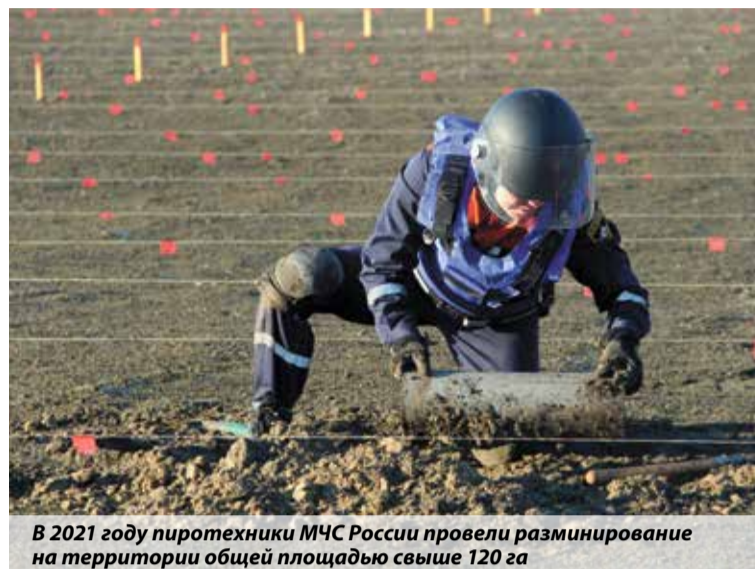
В 2021 году пиротехники МЧС России провели разминирование на территории общей площадью свыше 120 га

онной, химической и биологической защиты, где участники показали навыки по ведению разведки, оказанию первой помощи пострадавшим, надеванию средств индивидуальной защиты органов дыхания и зрения, работе в условиях установленных минно-взрывных заграждениях. Помимо