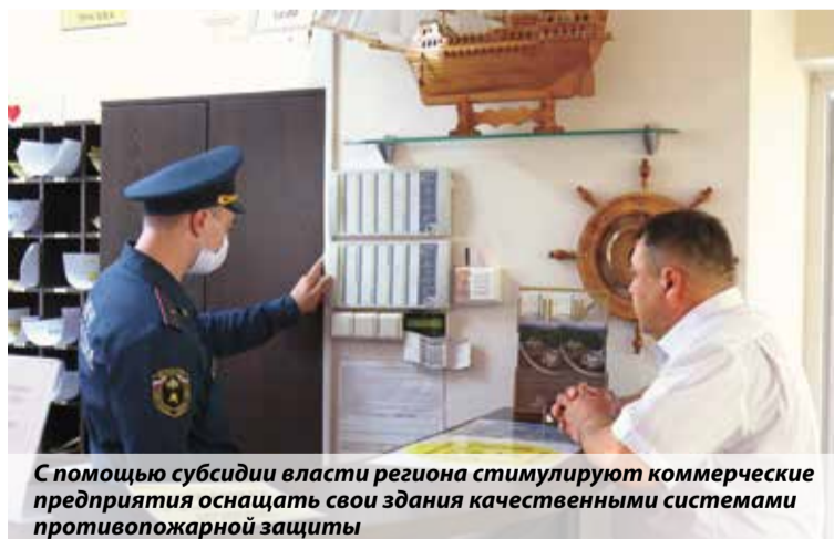
С помощью субсидии власти региона стимулируют коммерческие предприятия оснащать свои здания качественными системами противопожарной защиты

В результате было издано постановление правительства Алтайского края № 324 «Об утверждении Порядка субсидирования части затрат, связанных с приобретением субъектами малого и среднего предпринимательства оборудования в рамках реализации индивидуальной программы социально-экономического развития Алтайского края на 2020–2024 годы, утвержденной распоряжением Правительства Алтайского края от 08.04.2020 № 928-р».