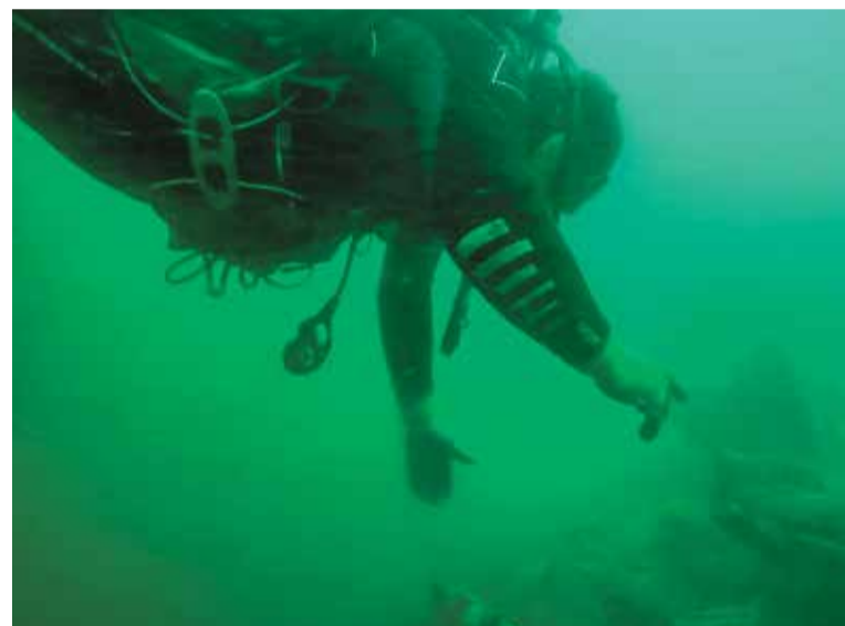
В общей сложности водолазы-пиротехники провели под водой время, равное 11 суткам

«Все работы по разминированию производились внутри трюмов, в замкнутом пространстве, причем основная часть боеприпасов находится под толщей ила. То есть при первом спуске еще что-то видно, но после начала размывки видимость становится просто нулевой. Водолазы работали буквально на ощупь. У каждого из нас свои ориентиры и хитрости по выходу из трюма, если вдруг возникнет аварийная ситуация. Но, слава богу, обошлось без происшествий.»