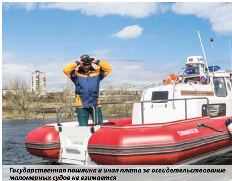
Государственная пошлина и иная плата за освидетельствование маломерных судов не взимается

в специально изданных информационных материалах. Можно лично обратиться в ближайшую инспекцию по маломерным судам.